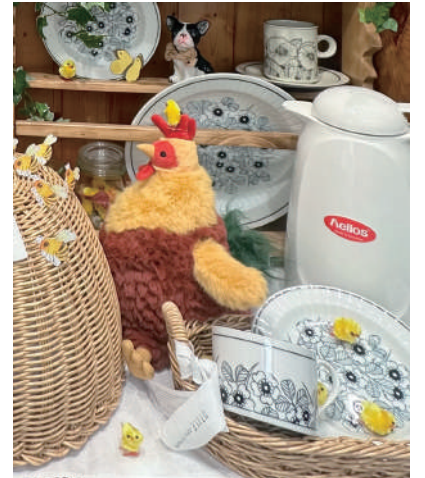
ニワトリさん親子。小さいヒヨコが ※ヒヨコは、非売品