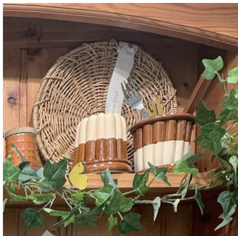
フランス伝統の焼菓子「カヌレ」の焼き型風プランターにカトラリーをさしたりスティックシュガーを入れたり