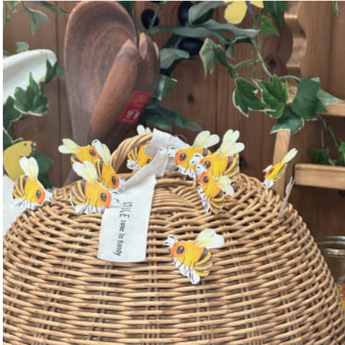
ハチさんが・・・