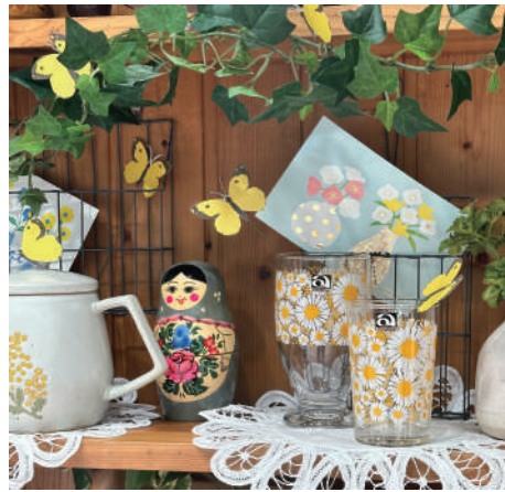
ちょうちょが、ひらひら。お花模様の食器に止まったり・・・